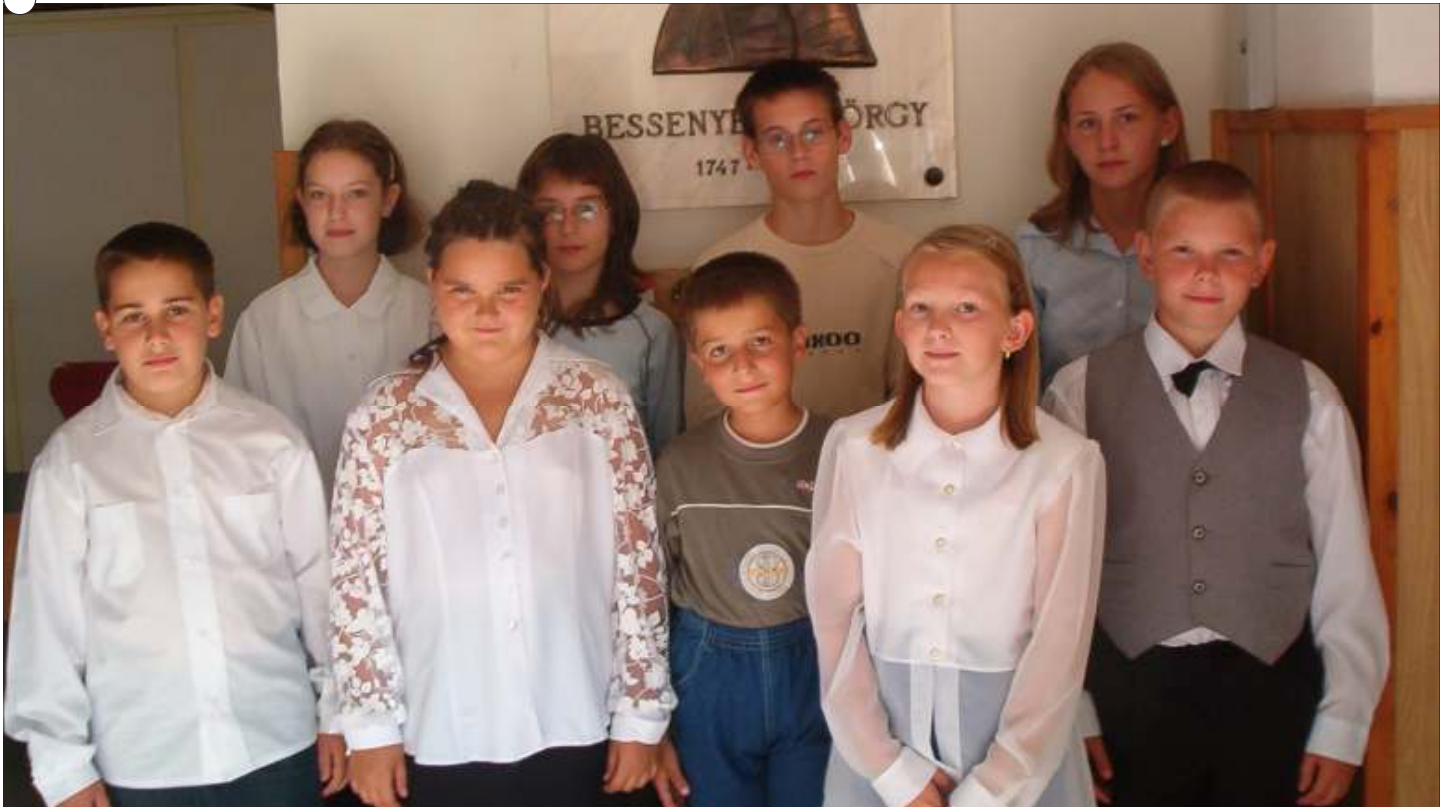
Kitűnő tanulóink voltak a 2004 / 2005 - ös tanévben: