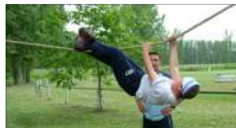
Lógtunk a szeren.