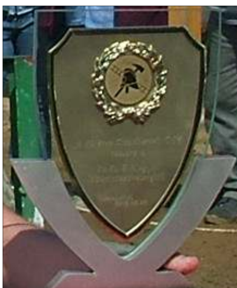
A megyei szövetség születésnapi ajándéka.