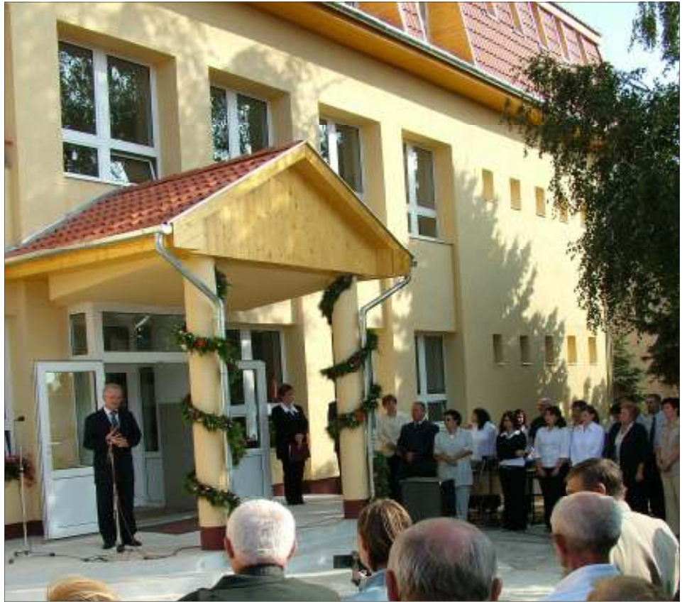
A megújult Szakiskola átadási ünnepségére díszbe öltöztetett főbejárata.

- A felzárkóztató osztályba olyan tanulók járnak, akik betöltötték 15. életévüket, illetve