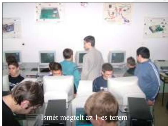
Ismét megtelt az 1-es terem