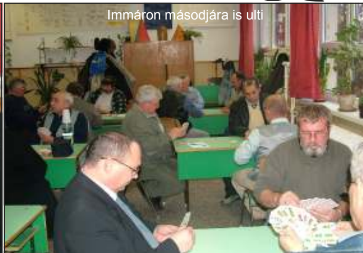
Immáron másodjára is ulti