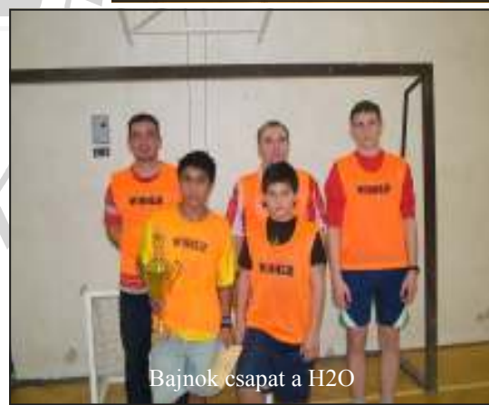
Bajnok csapat a H2O