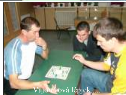
Vajon hová lépjek....

Ismét egy sikeres napot könyvelhet el a Berczeli Ifjúsági Kulturális Egyesület, ugyanis 2006. december 16-án immáron második alkalommal szervezte meg a Bercelen évek óta hagyományként megrendezett Sportbarátok napját. A versenyszámokra már reggel 8 órától lehetett nevezni. A sporteseményre folyamatosan érkeztek a versenyzők, a nap végére megtelt az iskola, s a legkitartóbb versenyzők, és szurkolóik éjszaka 11 órakor hagyták el az iskola tantermeit.