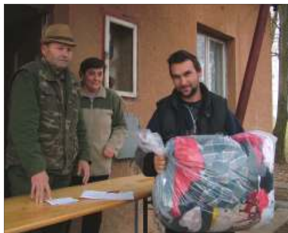
„Aki örül és átveszi az adományt”