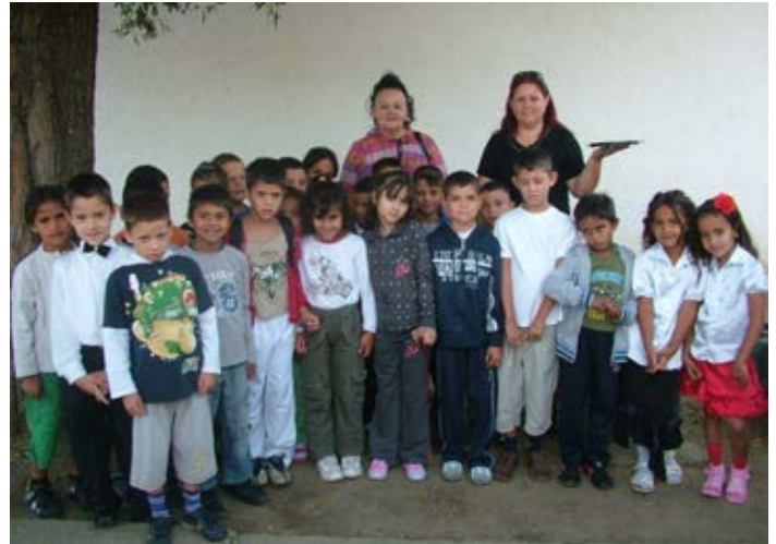
2011/2012 –es tanév első osztályosai

Iskolánk tanulói létszáma 173 fő, 3 napközis csoport működik teljes kapacitással. (1. és 6. osztály 30 fő, 2-3. osztály 29 fő, 4-5. osztály 31 fő).