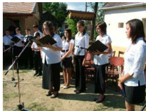
Általános iskolás gyerekek műsora

Az ünnepséget a Szózat, majd a muzikaszó hangja zárta.