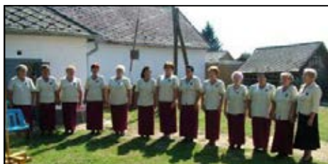
A Nyugdíjas énekkar műsora