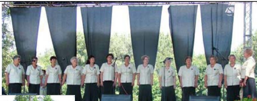
Tiszaberceli Nyugdíjasok énekes műsora