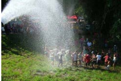
Habparty a Tisza-parton