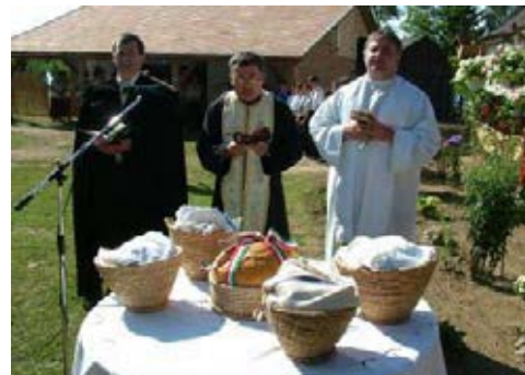
3 felekezet lelkésze megáldja és megszenteli a kenyeret