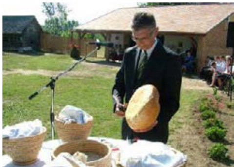
Polgármester úr megszegi az Új kenyeret