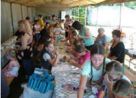
Ifjúsági Nap kézműves rendezvénye