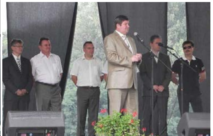
Az Önkormányzati Államtitkár Úr ünnepi köszöntője