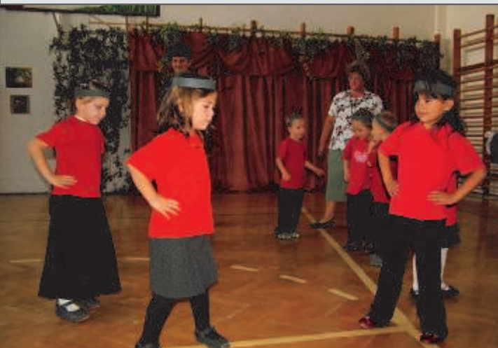
Óvodások katicabogár tánca az Idősek napi rendezvényen

Ezután a Szüreti mulatságra készültünk fel. Daljátékkal, versekkel, tánccal tettük emlékezetessé a délelőttöt, majd a nap fénypontja következett: a Romwalter házaspár zenés műsora. A Nád a házam teteje című dal éneklése közben tánca is perdültünk, de a többi zenés