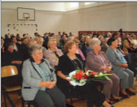
Idősek napja Tiszabercelen