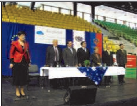
Szabolcs-Szatmár-Bereg Megyei Nyugdíjasok Idősek napja