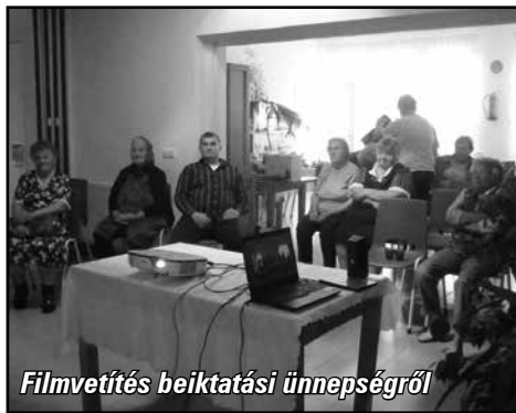
Filmvetítés beiktatási ünnepségről