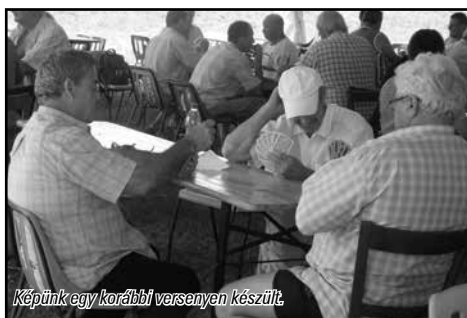
Képünk egy korábbi versenyen készült.

Az egyéni verseny (hivatalosan társasági-ulti) 3 régióban zajlik: Észak-Magyarország, Budapest, Dél-Magyarország. A mi régióinkban Debrecen, Nyíregyháza, Kisvárd, Sárospatak rendez versenyeket.