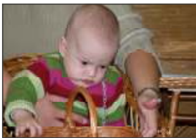
A fonás a kicsiket is érdekelte

Betekintést nyertünk az otthon életébe, az ott élő gondozottak nagy szeretettel mutatták be nekünk az ő kis "birodalmukat" melyből szeretet és az otthon melege sugárzott. Köszönjük az Otthon vezetőségének a meghívást, munkájukat, szeretetüket, a kellemes délutánt melyről fáradtan, de élményekkel gazdagabban tértünk haza.