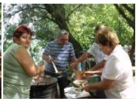
A NAP FOLYAMÁN LELKES SZAKÁCSOK KÉSZÍTETTÉK AZ ÍZLETES ÉTELEKET