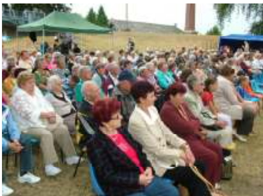
Kitartó és lelkes közönség