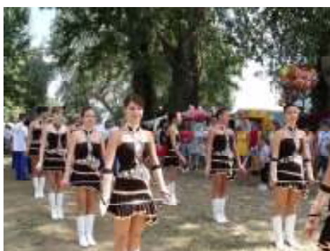
NÉHÁNYAN A FELLÉPŐK KÖZÜL