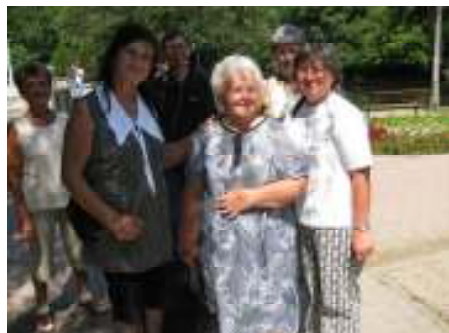
Tapolcai sétányon vendégünkkel