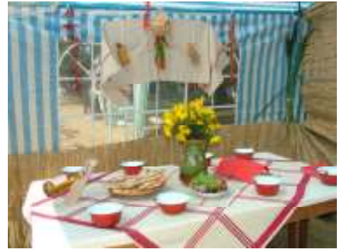
A REGGELI GYÜLEKEZŐ UTÁN MEGKEZDŐDTEK AZ ELŐKÉSZÜLETEK, ÉS ELKÉSZÜLT AZ ÜNNEPI TERITÉK