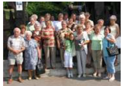
Csoportunk a Diósgyőri vár bejáratánál