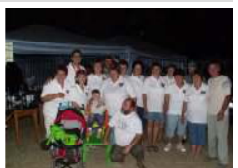
A ZSÜRI MEGVENDÉGELESE UTÁN ÖRÖMMEL VETTÜK ÁT A DÍJAT, ÉS ESTÉRE SEM CSÖKKENT A LÉTSZÁM